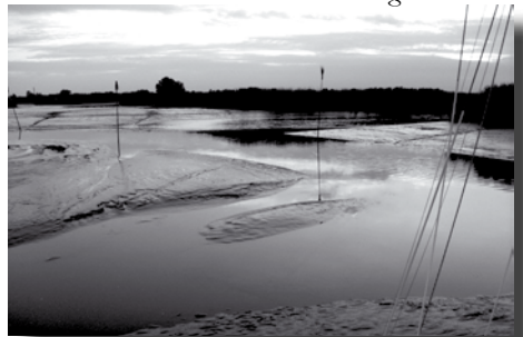
Einfahrt nach Haseldorf bei NW