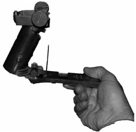
Is dat een Dampfmaschin?

Im übervollen Hafen hatten sie „Nari“ als 11. im Päckchen neben sich. Gemeinsam